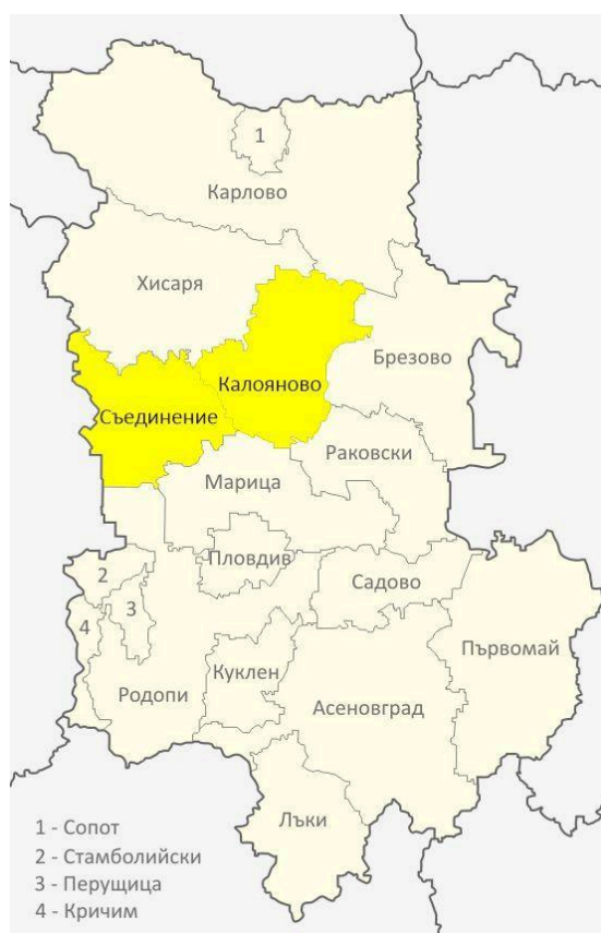
Карта на територията на МИГ „Калояново – Съединение“

Територията на МИГ „Калояново – Съединение“ обхваща изцяло всички населени места на техните територии и попада в обхвата на Южен централен район. Общият брой населени места на територията на община Съединение е 10, а на територията на община Калояново – 15.